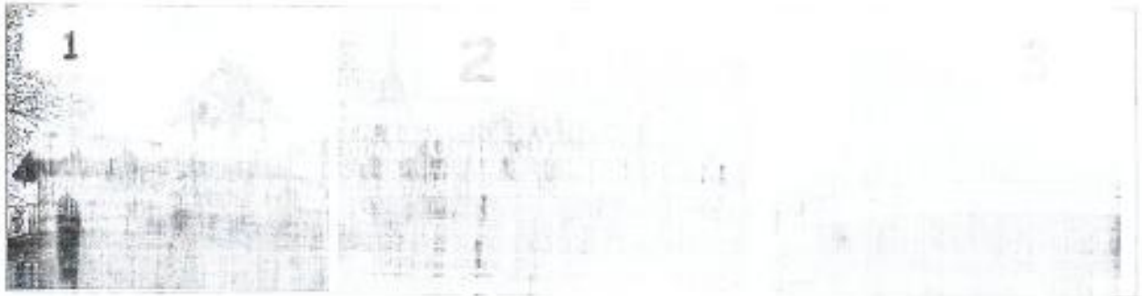
Таблица 3. План-эскиз памятника арх. наследия в границах ист. территории об. «...» в ст. вост. берега р. Дона. План-эскиз (с. 10) зад. №... — 12 лет (по ист. времени) (с. 10)